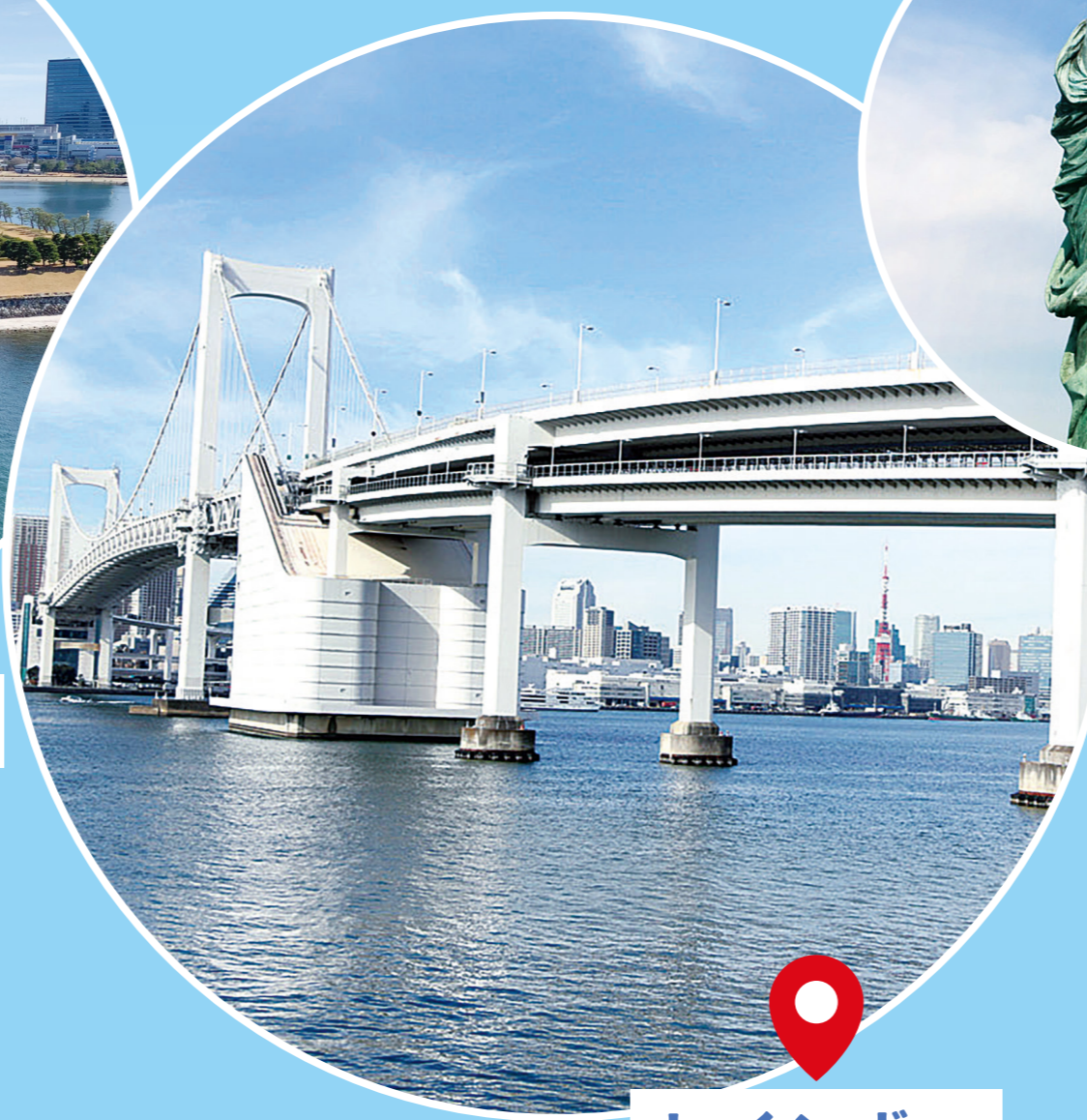
レインボーブリッジ