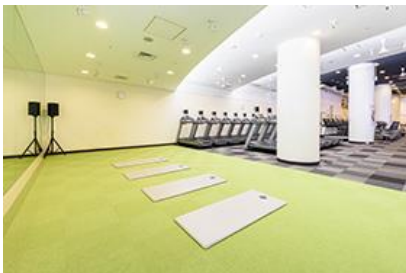
<ストレッチスペース>