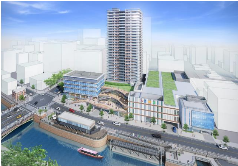
「テラッセ納屋橋」イメージパース