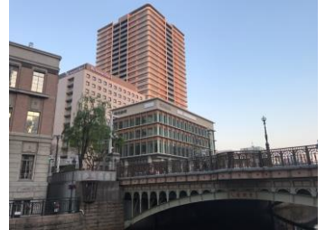
「テラッセ納屋橋」外観