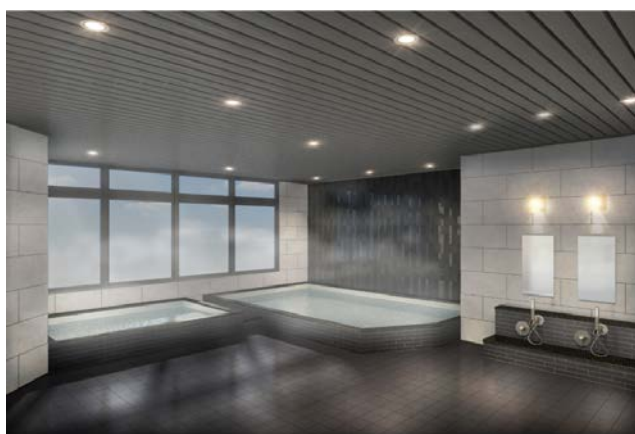
リラクゼーション&スパ