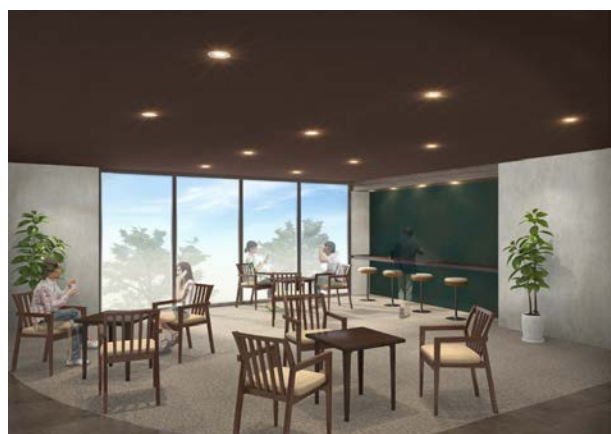
コミュニケーションスペース