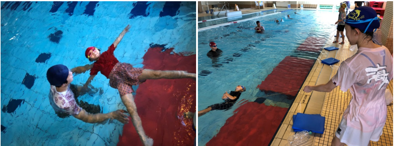
< 着衣泳教室の様子 >