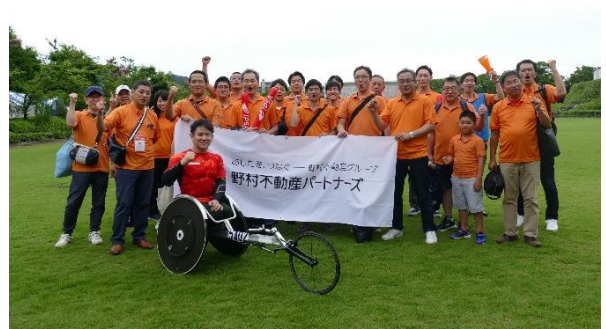
2019 ジャパンパラ陸上競技大会（岐阜）応援（今年9月）