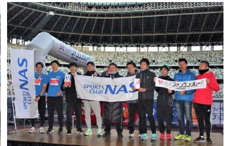
3位 | NAS パッションランチーム