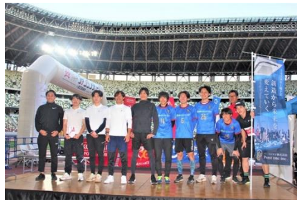
2位 | パーストワン株式会社チーム