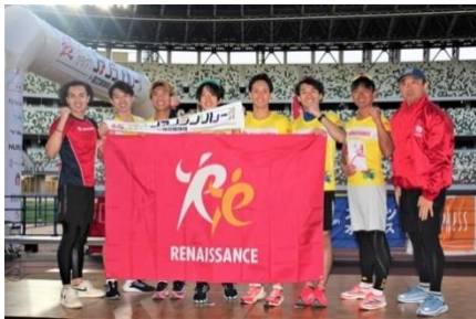
優勝 | ルネサンス駅伝部 A チーム

中学生以上を対象に、10人までのチームで行うリレー形式のマラソン。1周約1.4kmのコースを何周目で交代してもよく、また1人が何度走ってもよいというルールのもと、4時間たすきを繋ぎ続けます。202組のエントリーの中から、より多くの周数を完走した上位3チームが表彰されました。参加者からは「やり切った！出し切った！楽しかった！！」（30代男性）「久しぶりに走ったらこんなにツライんだと思った。でも気持ちいい〜」（30代女性）や、「チームで4回くらい練習会をやって臨みましたが、今日はテンションが上がり、みんな練習以上のチカラが出せています。最高の気分！チームのメンバーは口々に『出なかった人はもったいない』と言っています」（出場スポーツクラブの支配人）などと話していました。