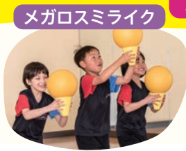
メガロスミライク