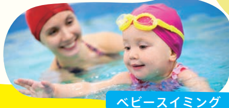
ベビースイミング