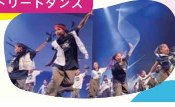
ストリートダンス