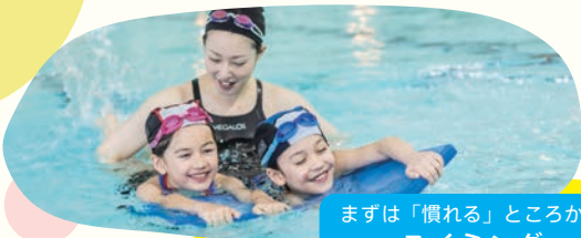
まずは「慣れる」ところから スイミング